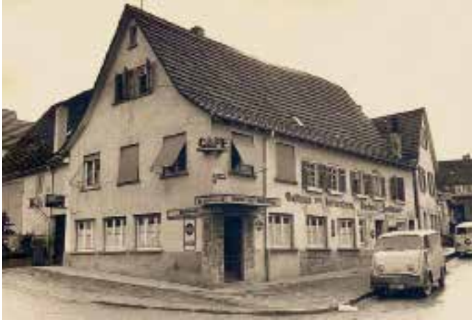
Bild 1: Das „Gasthaus zum Kernenturm“. Das Bild muss Ende der 40er-Jahre aufgenommen worden sein: Wenn man ganz genau hinschaut, kann man auf dem Nummernschild des Borgward-Lieferwagens (!) vorne ein „F“ über einem „Z“ erkennen. Es muss also ein Lieferwagen aus der „französischen Zone“, d.h. westlich von Stuttgart, gewesen sein. Am 23. Mai 1949 wurde die französische Zone aufgelöst und damals „Württemberg-Baden“ kam zur neugegründeten „Bundesrepublik Deutschland“, ehe 1952 durch Zusammenschluss mit Württemberg-Hohenzollern und (dem Rest von) Baden „Baden-Württemberg“ daraus wurde.