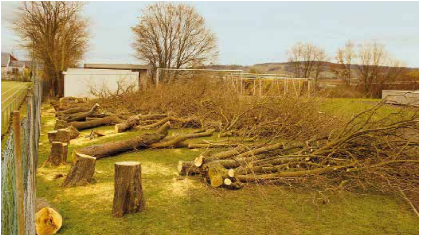
Am 7. Februar 2014 fielen die Maulbeerbäume der Säge zum Opfer

klettert, hat sich manchmal auch über die „Sauerei“ der Früchte geärgert. Jetzt sind sie weg. Sie sind den allgemeinen Pflegemaßnahmen der Baumbestände zum Opfer gefallen. Wer schnell war, konnte sich mit Brennholz für den nächsten Winter eindecken, der eine oder andere Kunsthandwerker hat sich wohl auch das sehr langsam gewachsene Holz für Drechsel- und Schnitzarbeiten gesichert, das meiste wurde aber wohl geschrettert. Der Anblick der gefällten Bäume erweckte etwas nostalgische Gefühle. Aber heutzutage kann man nicht mehr einfach so Bäume fällen. So werden im vorliegenden Fall von der Gemeinde neue Bäume (sicher keine Maulbeerbäume mehr) gepflanzt und bald wird nichts mehr an die Maulbeerbäume erinnern.