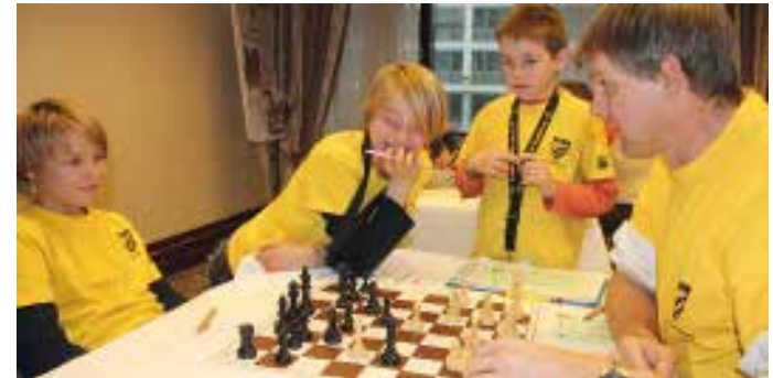
Analyse Runde 4