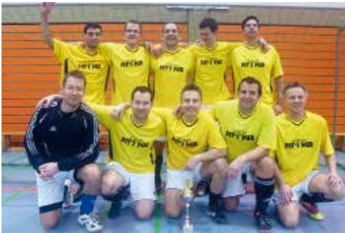
Die „Römer“ AH-Mannschaft beim eigenen Hallenturnier 2013