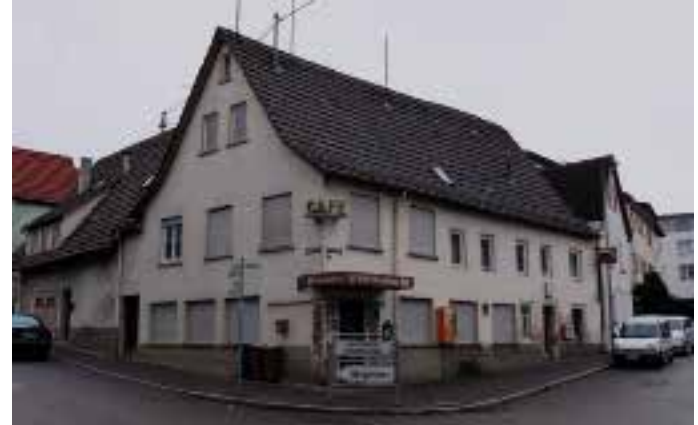
Bild 3: Das „Kaffee Nussbaum“ heute kurz nach dem Schließen. Die „Ähnlichkeit“ zu den 40er-Jahren ist unverkennbar.