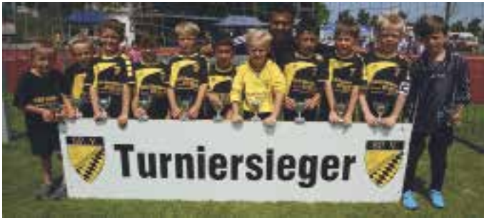
Turniersieger – und das sogar beim eigenen Turnier: Unsere G-Junioren