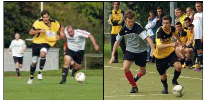
Bei den Herren muss das neue Trikot der „Römer“ einiges aushalten