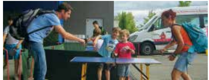
Selbst ein Rucksack ist kein Hinderungsgrund.