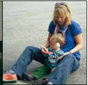
Auch die Aller kleinsten können schon mit dem Zelluloidball beschäftigt werden.