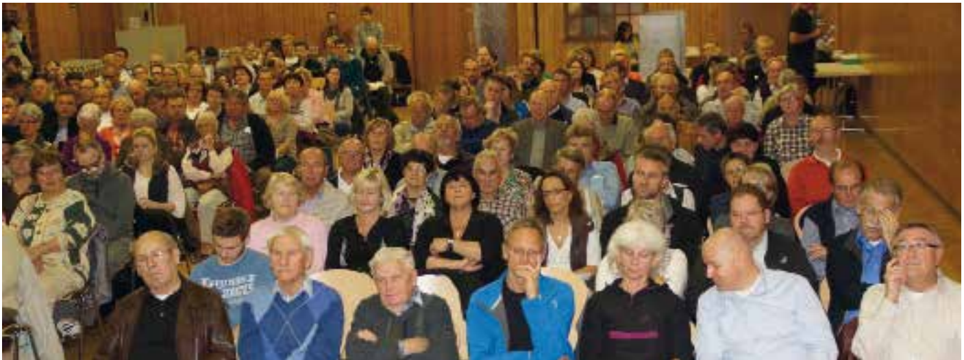
297 stimmberechtigte Mitglieder waren bei der außerordentlichen Mitgliederversammlung anwesend.