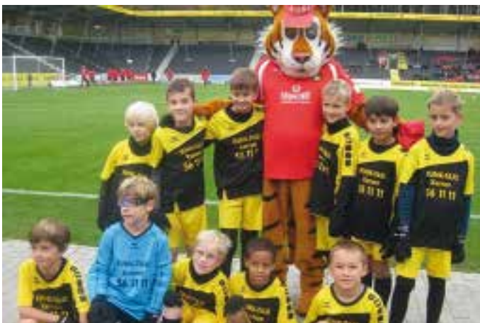
Mit der SG Sonnenhof Großaspach und Maskottchen Benny zum Regionalligaspiel in die Comtech Arena eingelaufen: Die F 1