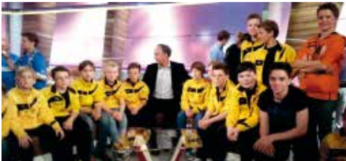
Die D-Junioren auf dem Sofa von „Sport im Dritten“ mit Hansi Müller