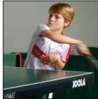
Ein erfolgreiches und dynamisches Rückspiel gegen den TT-Roboter.