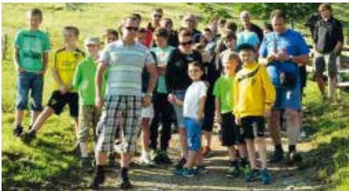
Die D- und E-Junioren beim Ausflug ins Allgäu