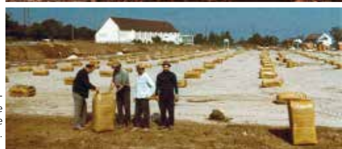
Die Bulldozer amerikanischer Pioniere übernahmen die massiven Erdarbeiten.