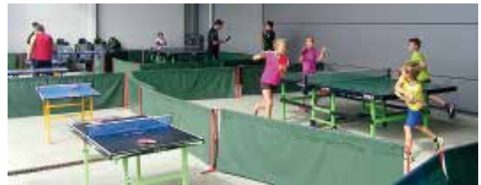
Jung und Alt an den verschiedenen Stationen im TT-Parcour.

Aktuelle Informationen über alle Mannschaften und Tabellenstände, die Spieler, die lizenzierten Trainer, den Abteilungsvorstand, Historisches und vieles mehr erhalten Sie auf unserer Homepage www.ttrom.de