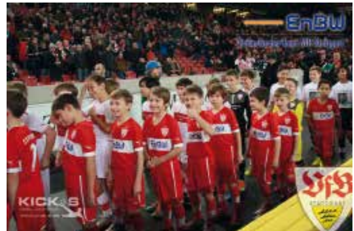
Der 2002er Jahrgang kurz vor dem Einlaufen in die Mercedes-Benz-Arena mit den VfB-Profis