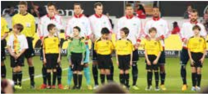
Begleiteten den HSV auf den Rasen in der MB-Arena: unsere E-Junioren